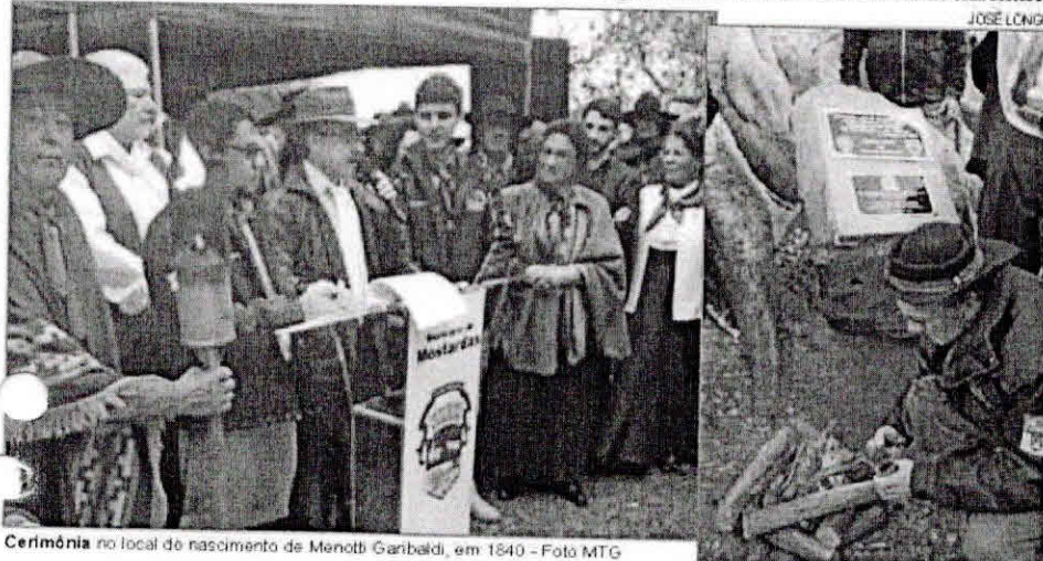
Cerimônia no local do nascimento de Menotti Garibaldi, em 1840

Em Espumoso, a previsão de chegada é na segunda-feira, 14, por volta das 16 horas, no Frigorífico da Cotriél, seguindo ao Parque Municipal Armídio Bertani, já adiantando preparativos para as comemorações que lembram em 2017, os 70 anos da criação da Chama Crioula, o símbolo máximo da Semana Farroupilha.