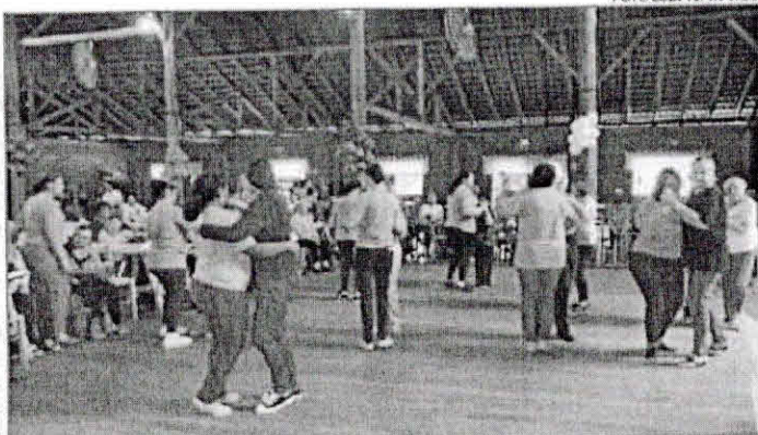
Evento reuniu idosos de várias instituições

A Obra Social Santa Júlia, instituição que dedica trabalho no cuidado com as idosas de Espumoso, realizou o 6º Encontro dos Institutos de Longa Permanência para Idosos. O evento ocorreu no GAN Sepé Tiaraju, na quarta-feira, 26. Na ocasião foram recepcionadas as idosas da Casa Lar Dona Celestina, de Selbach; Casa Betânia, de Não-Me-Toque; o grupo de irmãs De Bem com a Vida; o Lar do Idoso Luiz Caraffa e irmãs das demais unidades religiosas e da Congregação Notre Dame.