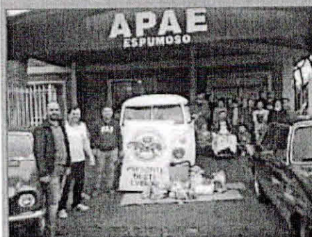
Alimentos repassados à Apae e Cimes

Ontem à tarde, o Clube do Antigo Mobilismo repassou ao Cimes e Apae, cerca de 300 kg de alimentos impercíveis arrecadados por ocasião das inscrições dos participantes do 5º Encontro de Carros Antigos, promovido no último domingo, na Praça Arthur Ritter de Medeiros.