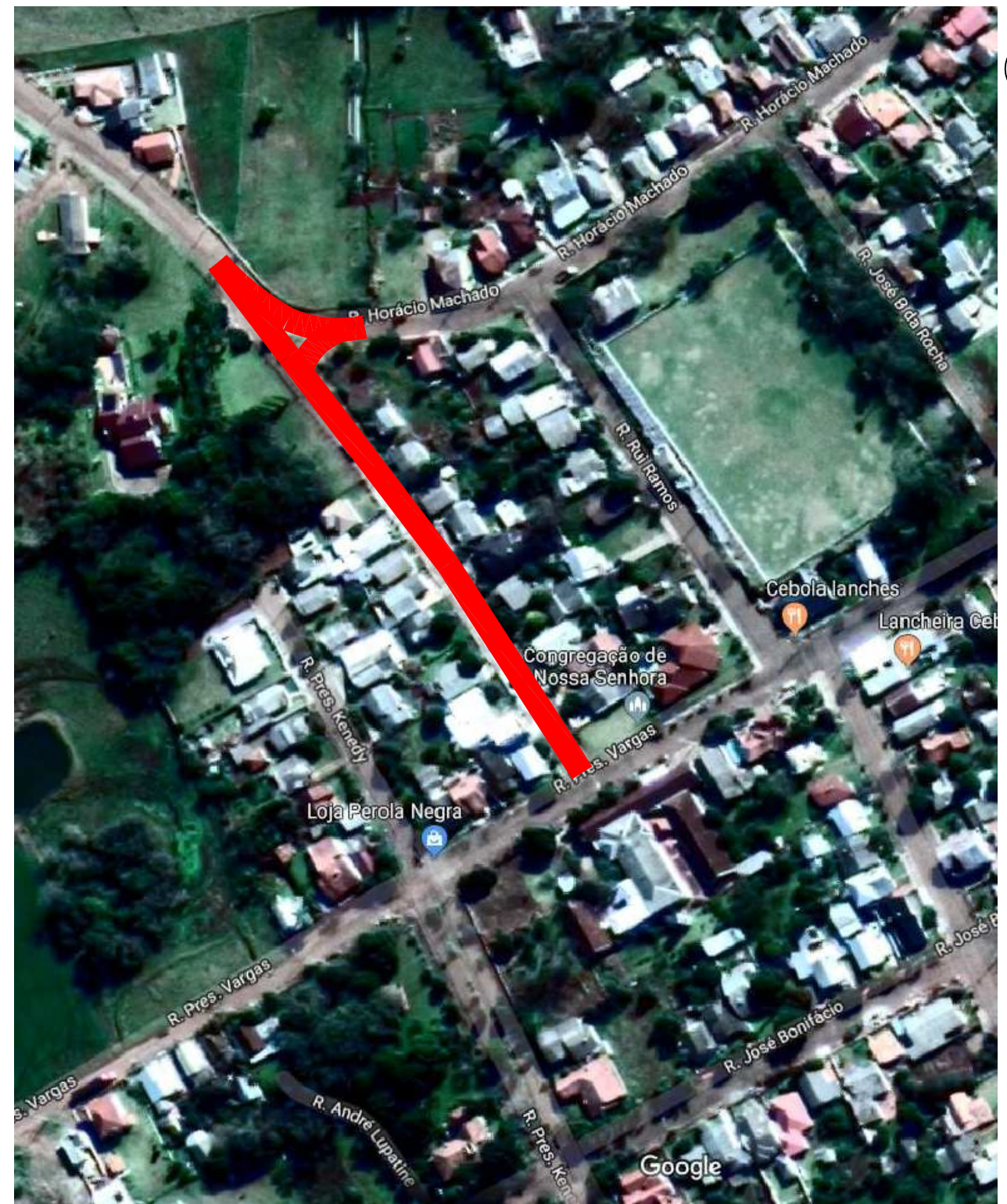
LOCALIZAÇÃO Imagem do Google Sem escala