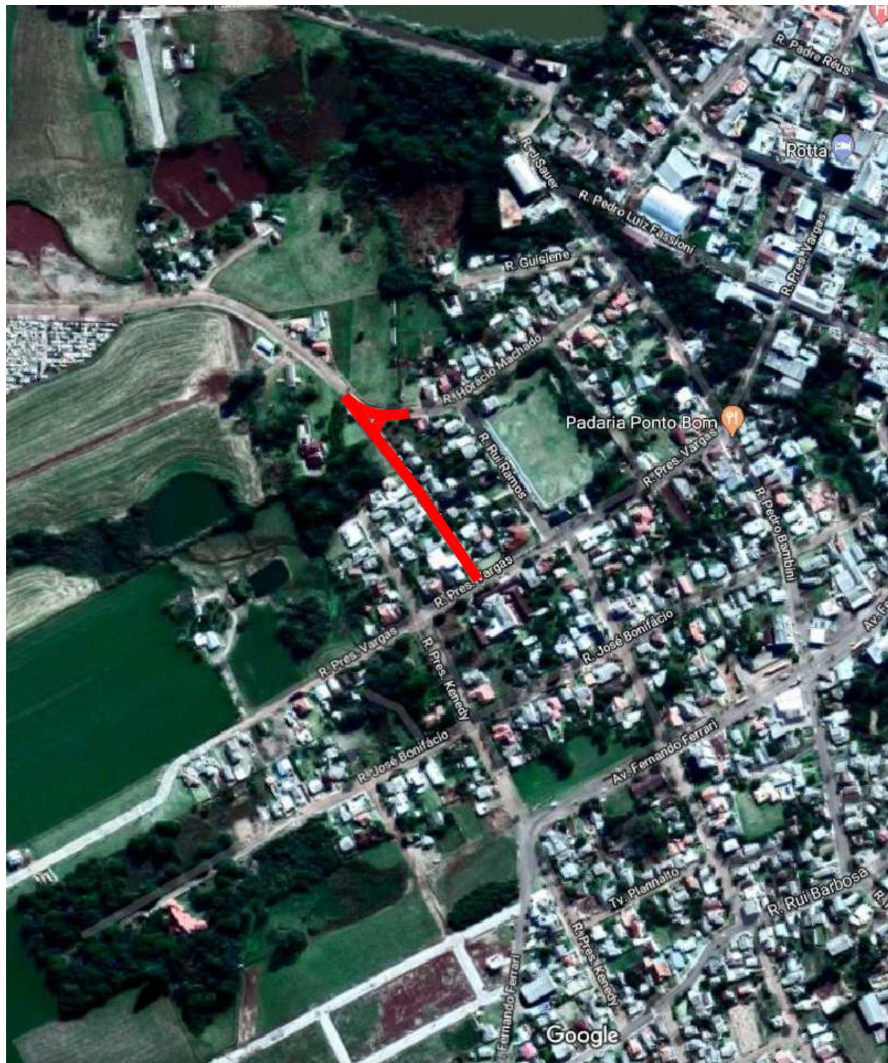
SITUAÇÃO Sem escala