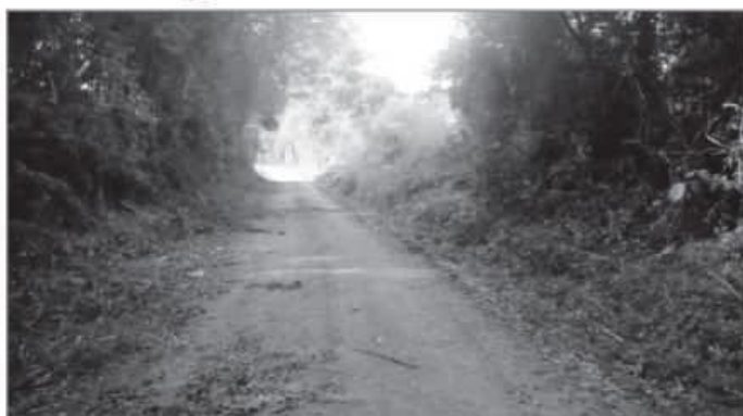
Limpeza nas margens das estradas do interior dá mais visibilidade aos trânsito

Entre as melhorias executadas pela Secretaria Municipal de Transporte e Trânsito de Espumoso, está a utilização da roçadeira hidráulica que proporciona limpeza às margens das vias. O serviço de limpeza dá mais visibilidade aos trechos, bem como possibilita o trabalho com as patrôlas. O equipamento novo estava encostado há mais de dois anos e agora foi ativado para auxiliar nas operações de melhorias das estradas. Também segue o patrulamento e colocação de brita.