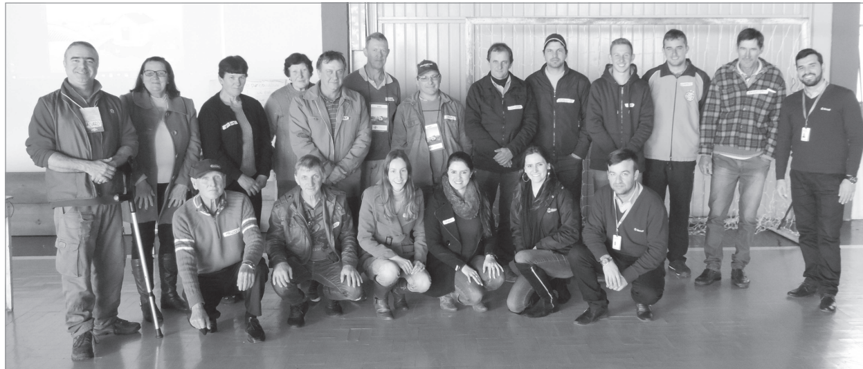
Associados reunidos na comunidade do Pontão do Butiá

Esta oficina é ofertada aos associados do público agro e tem como objetivo auxiliar na gestão e organização das propriedades e vem ao encontro do pensamento da instituição financeira cooperativa de estar cada vez mais próxima do seu associado.