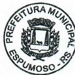
Jyryes Sad Fiscal Municipal Matricula 1093