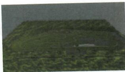
Autódromo de Goiânia

sexta-feira, 4 de outubro de 2013 às 15:20