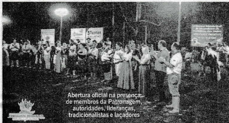
Abertura oficial na presença de membros da Patronagem, autoridades, lideranças, tradicionalistas e laçadores