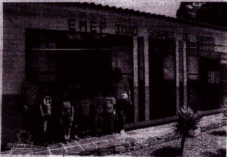
Grupo da Administração Municipal na EMEF João Soares de Barros na localidade do Portão