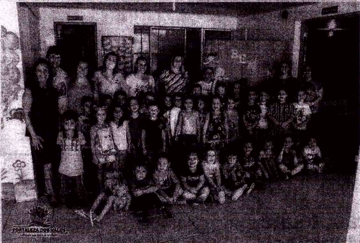
Registro com a Direção, professores e algumas turmas da EMEI Vó Justina Rossatto