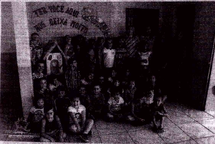
Prefeita, Secretária de Educação e Coordenadora Pedagógica durante visita a Escola Municipal Santa Cruz situada na comunidade de Esquina Gaúcha