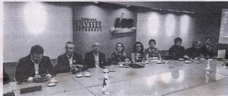
Reunião visou analisar os impactos causados pelas Propostas de Emendas à Constituição (PECs) que tratam da reforma tributária visando traçar as estratégias em defesa dos municípios na garantia dos seus direitos adquiridos