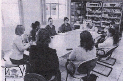
Na reunião ficou agendada a data de 26/10 para a realização da competição

Com informações da Assessoria de Imprensa Poder Executivo