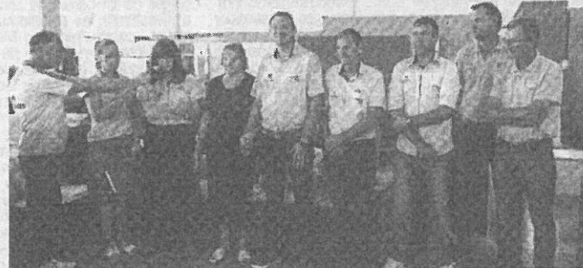
Proprietários da empresa, deixando sua mensagem aos presentes