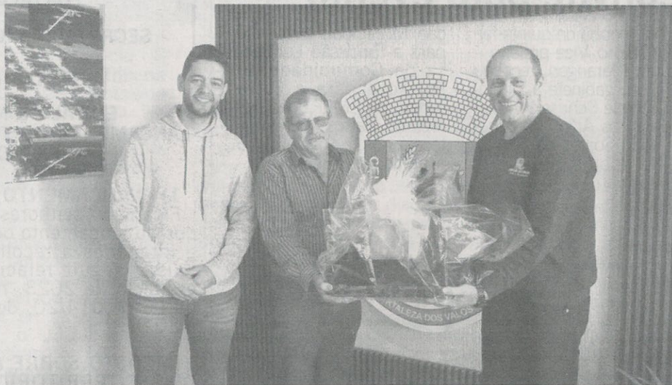
Na foto, o Vice e secretário de Administração recebendo uma lembrança da Associação como forma de agradecimento pela parceria constante