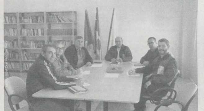
Fechamento do cultivo de verão foi um dos assuntos da reunião

Estatísticas Agrícolas. Na oportunidade, falaram sobre o fechamento do cultivo de verão, onde a soja teve um rendimento médio de 20sc/ha. Esteve em pauta também o plantio da cultura de inverno do trigo e aveia.