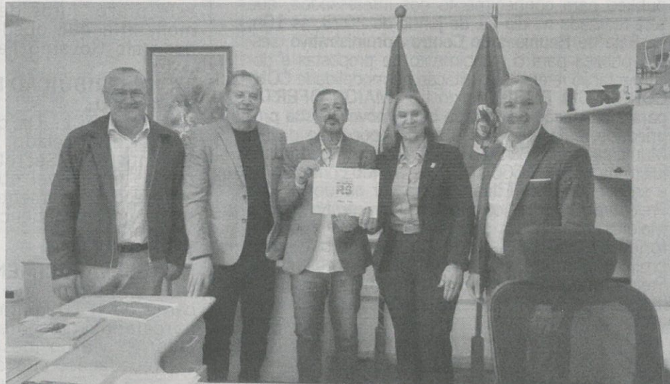
Dentre os locais visitados estiveram o Badesul e Secretaria de Apoio aos Municípios