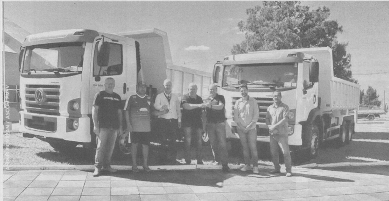
Os dois veículos recebidos no início da semana, passam a integrar a frota municipal