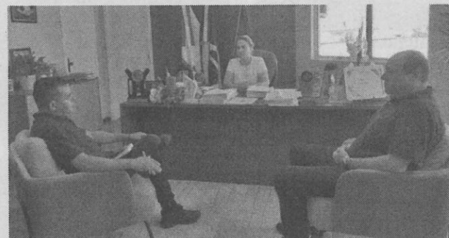
Foram debatidos diversos assuntos de interesse da municipalidade