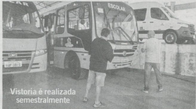
Vistoria é realizada semestralmente

A Administração Municipal, reforça seu compromisso com a segurança e o bem-estar dos alunos da rede municipal de ensino.