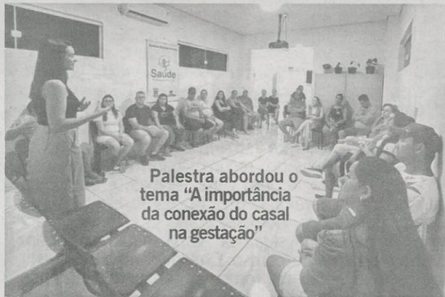
Palestra abordou o tema "A importância da conexão do casal na gestação"

Sabemos o quanto esses encontros são essenciais para as gestantes. Além de receberem informações importantes, também têm a oportunidade de compartilhar suas angústias, dúvidas e alegrias com outras pessoas que estão vivendo experiências semelhantes.