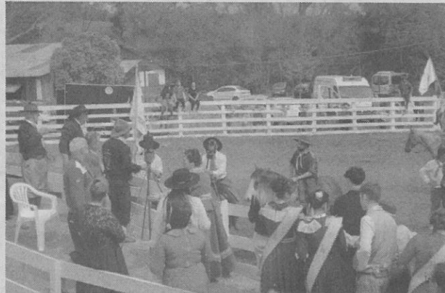
Grupo recebeu a centelha em solenidade no domingo