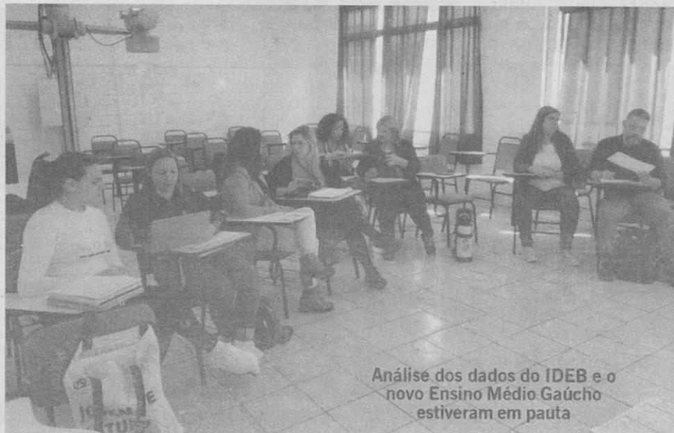
Análise dos dados do IDEB e o novo Ensino Médio Gaúcho estiveram em pauta