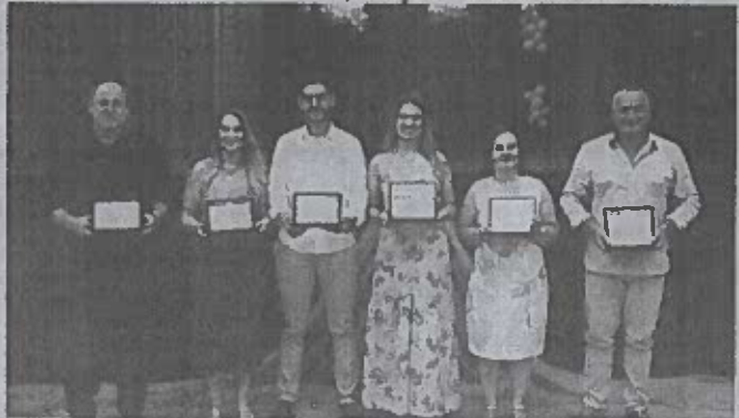
Chefes do Executivo 2021/24 homenageados pelo trabalho realizado em prol do município e secretários presentes recebendo uma placa em reconhecimento por sua dedicação