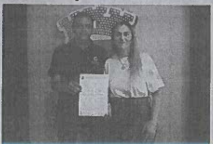
Registro da entrega do montante aos cofres públicos, realizado no final de 2024

Ação de um testemunho claro do desejo de contribuir efetivamente para a construção de uma cidade mais justa, próspera e acolhedora.