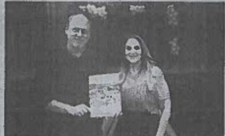
Representantes do Executivo 2021/24, com a revista de prestação de contas dos dois mandatos

ção ao município. Para encerrar a noite, os presentes participaram de um coquetel, celebrando juntos as conquistas e reforçando os laços que continuam a construir uma Fortaleza mais forte e próspera.