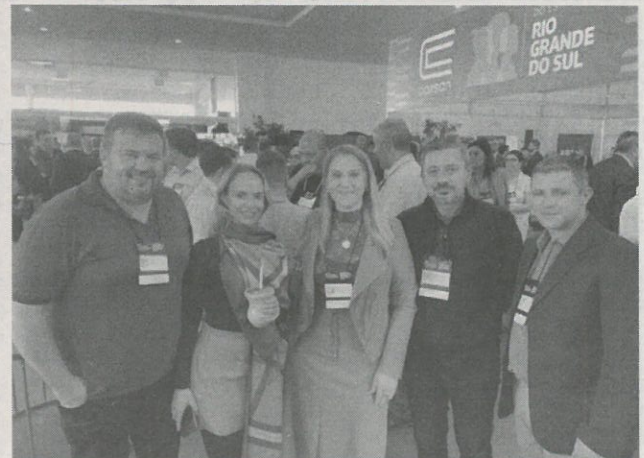
Durante o congresso, esteve em contato com diversas autoridades e lideranças do Estado