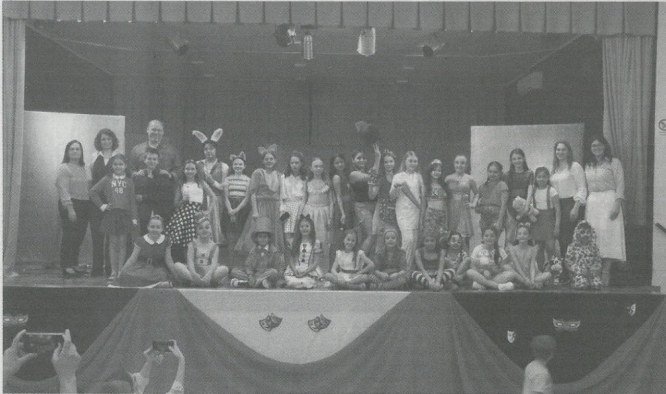
Autoridades e professora responsável pelo projeto, juntamente com os alunos que deram show de atuação

Na última sexta-feira (17), mais de 30 crianças, participantes do projeto de teatro do município, subiram no palco do Centro de Cultura e Eventos de Fortaleza dos Valos, para encantar o público com quatro peças teatrais repletas de emoção e criatividade.