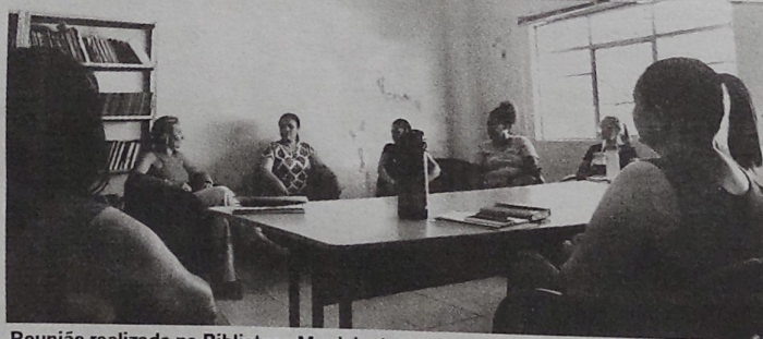
Reunião realizada na Biblioteca Municipal, abordou diversos assuntos relacionados a atividades e eventos a serem realizados no decorrer do ano...