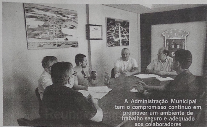
A Administração Municipal tem o compromisso contínuo em promover um ambiente de trabalho seguro e adequado aos colaboradores