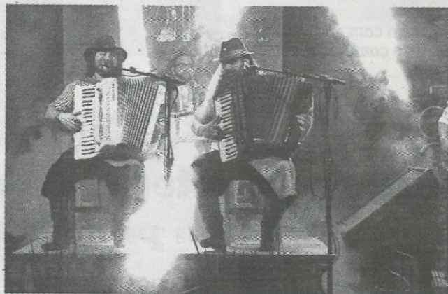
Grupo Cordiona animou a noite festiva