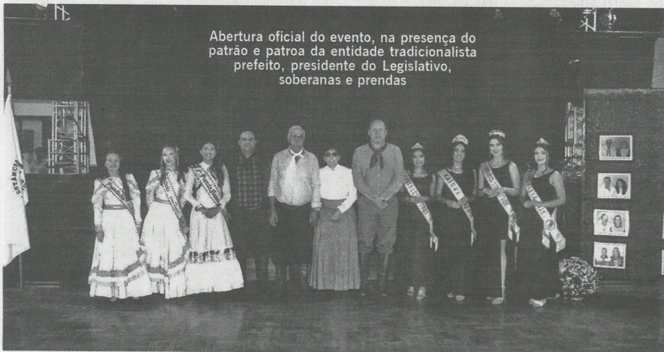
Abertura oficial do evento, na presença do patrão e patroa da entidade tradicionalista prefeito, presidente do Legislativo, soberanas e prendas

Na noite de 02 de maio, o CTG Estância do Umbu comemorou seu 41º aniversário com um belo Jantar Fandango, reunindo em sua sede social, associados, autoridades e comunidade local e regional, em uma celebração repleta de tradição e emoção.