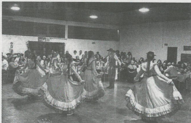
Grupo de Boa Vista do Incra realizou linda apresentação

A Administração Municipal parabeniza o CTG Estância do Umbu pela comemoração dos seus 41 anos de história e pelo compromisso