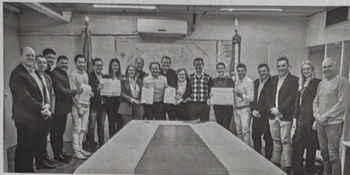
Reunião contou com a presença de autoridades e lideranças estaduais, regionais e representantes Comaja