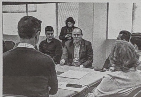
Foram apresentados relatórios atualizados sobre a execução dos trechos em andamento nas ERS-510 e RS-451, além de detalhes técnicos que seguem em ajustes...