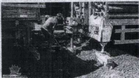
Trabalho realizado nesta semana, beneficiará de 90 a 100 famílias da localidade