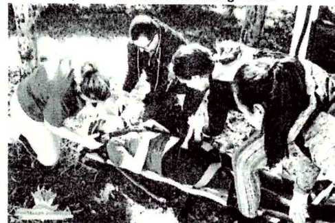
... que envolvem pressão para agir com rapidez e precisão