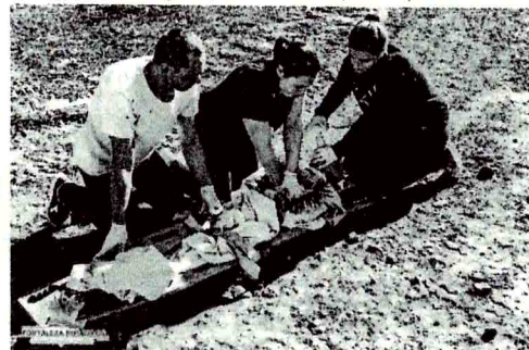
Objetivo da capacitação foi treinar o grupo para atendimentos de emergência...

beniza todos os profissionais que participaram do curso, com aprovação de 100% dos participantes.