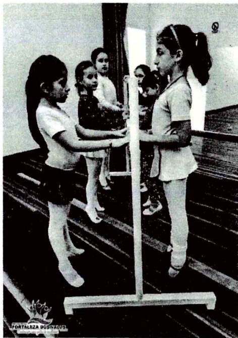
As pequenas bailarinas já utilizaram as barras adquiridas no ensaio desta semana