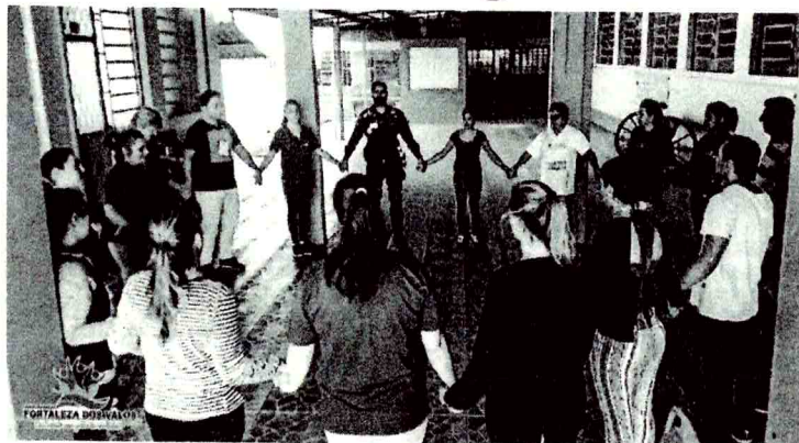
Profissionais fortalezenses participaram de importante qualificação

Para salvar uma vida é preciso ter uma pessoa designada para tal função, e esse papel cabe ao socorrista. Ele deve ser um profissional treinado para prestar o primeiro socorro e auxiliar os profissionais de atendimento pré-hospitalar, no local da emergência.