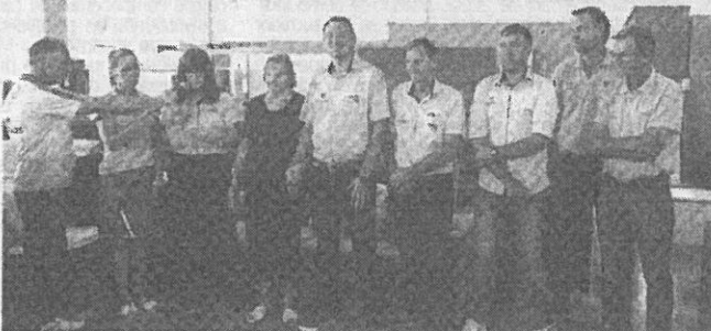
Proprietários da empresa, deixando sua mensagem aos presentes