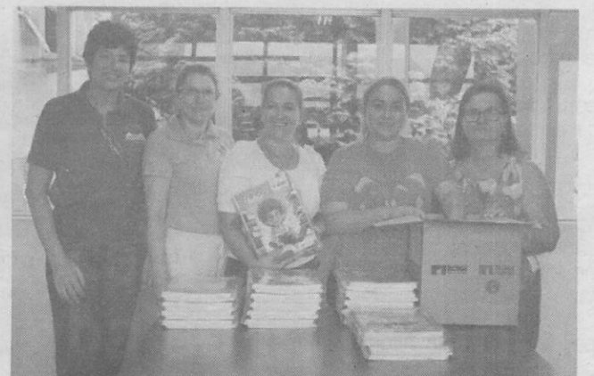
Diretora e docente da EMEF Santa Cruz da comunidade de Esquina Gaúcha recebendo os kits

*Texto: SMECD