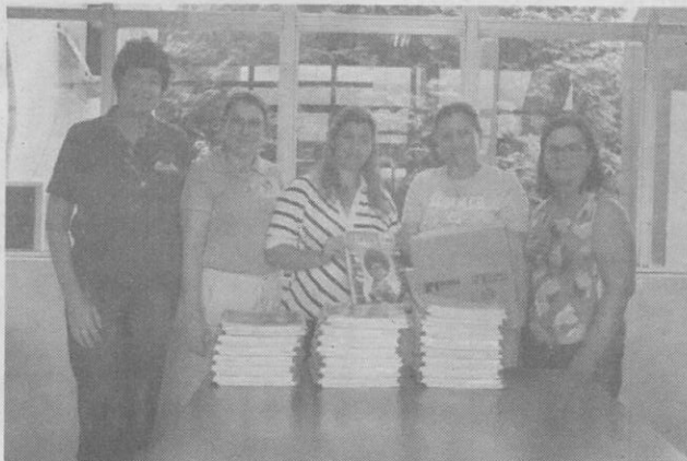
Entrega do material a diretora e professora da EMEF João Soares de Barros do Portão