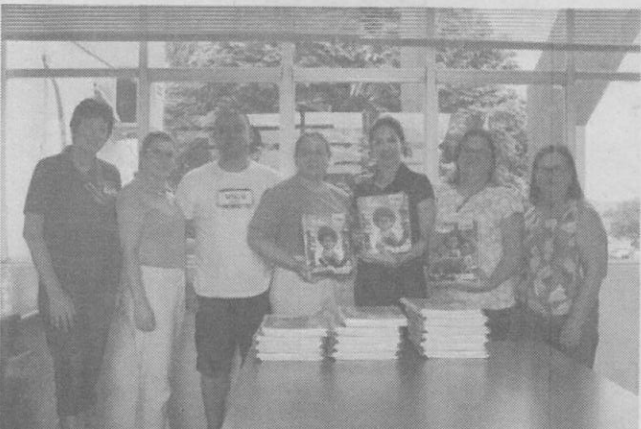
Equipe da Secretaria de Educação realizando a entrega a direção e professoras da EMEF 18 de Abril

Em 29 de fevereiro, foi feita a entrega do primeiro módulo dos kits de Alfabetização, direcionados aos alunos e professores do 1º e 2º Anos, do Ensino Fundamental, das escolas municipais de Fortaleza dos Valos. O referido material faz parte do Programa Alfabetiza Tchê, vinculado ao Compromisso Nacional da Criança Alfabetizada. Para fazer a entrega dos kits foram convocadas as instituições de ensino - EMEF 18 de Abril (sede), EMEF Santa Cruz (Esquina Gaúcha) e EMEF João Soares de Barros (Portão,