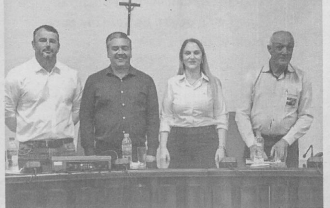
Foto com a nova diretoria da Associação para o ano de 2024