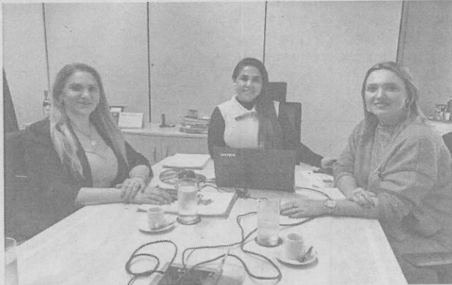
Na CNM, as autoridades estiveram reunidas com representantes de diversos setores, além de reunião no MAPA