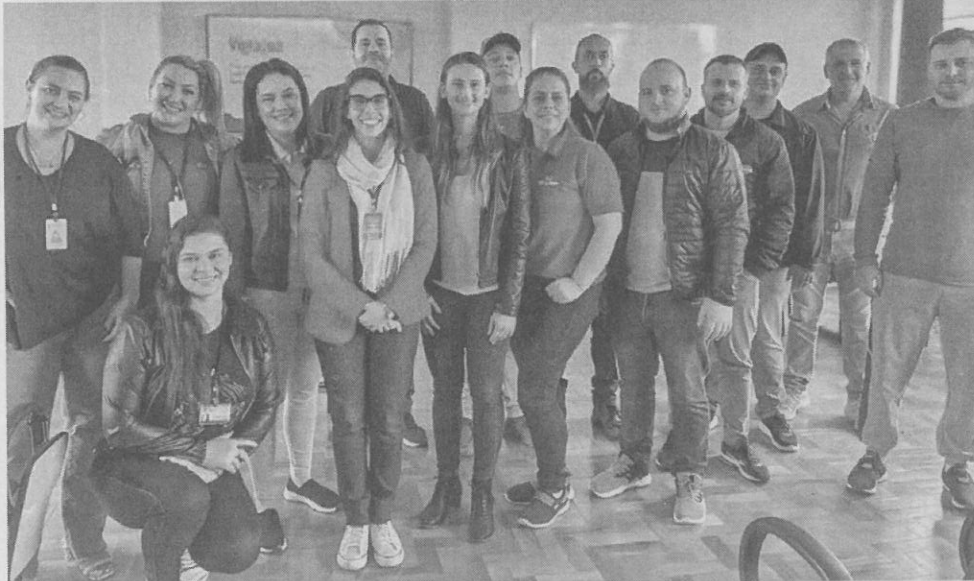
Ações de proteção à qualidade da água para consumo humano foram tema central da capacitação

Vamos juntos cuidar para que nunca falte água de qualidade, adotando práticas sustentáveis e promovendo a conscientização sobre a importância desse recurso precioso.