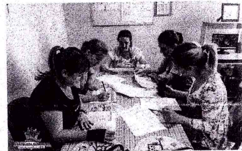
Docentes da Educação Infantil também estiveram reunidos para estudar a Base Nacional Comum Curricular (BNCC)