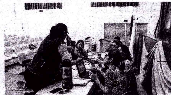
Trabalho foi realizado com professores da Rede Municipal e Estadual no Centro de Cultura e Eventos e na sala de reuniões da Biblioteca, visando estudo detalhado que abrange Ensino Fundamental e Médio e Educação Infantil