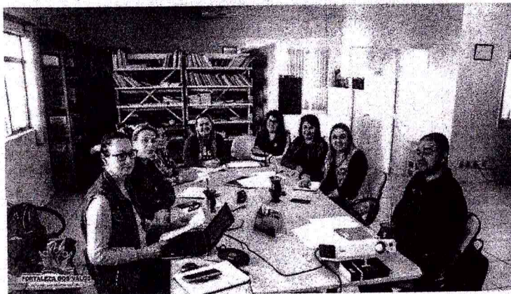
... no trabalho oportunizado pela Secretaria de Educação, Cultura e Desporto de Fortaleza dos Valos