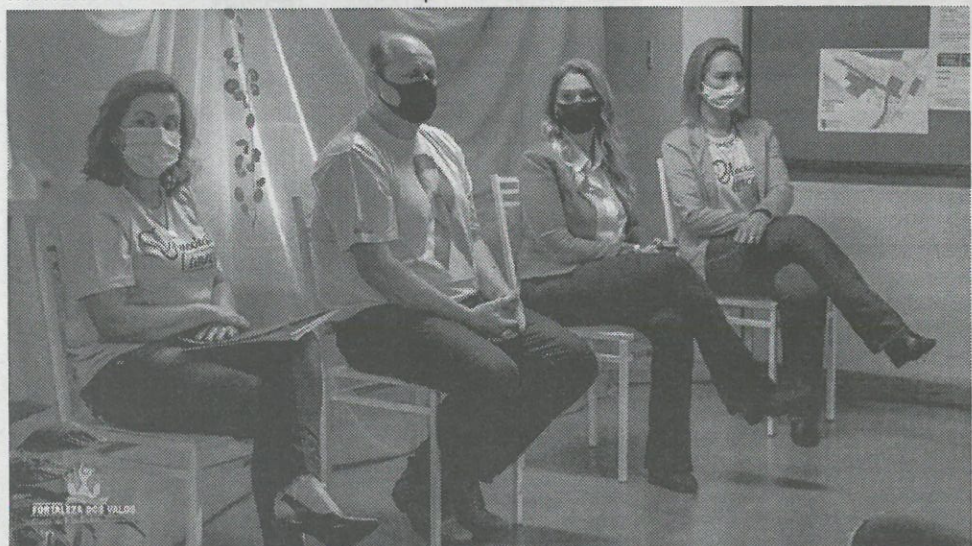
Vereadora e Presidente da AACAS, vice-prefeito, prefeita e presidente do Legislativo