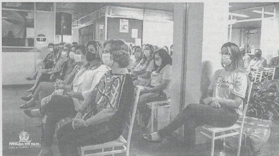
Homenageadas e convidadas para a cerimônia realizada na noite da última sexta-feira no Centro Administrativo