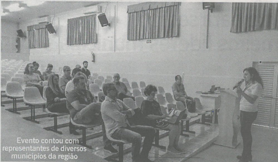
Evento contou com representantes de diversos municípios da região