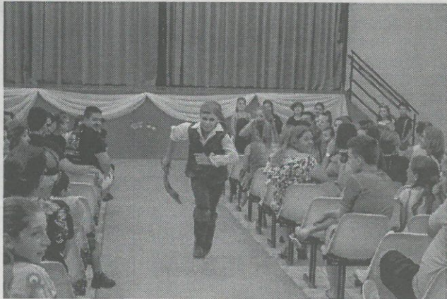
Alunos encantaram o público com três peças teatrais

favorecimento da interação entre outras pessoas; elevação no interesse pela literatura; estímulo da criatividade; aumento do senso de responsabilidade e muito mais.