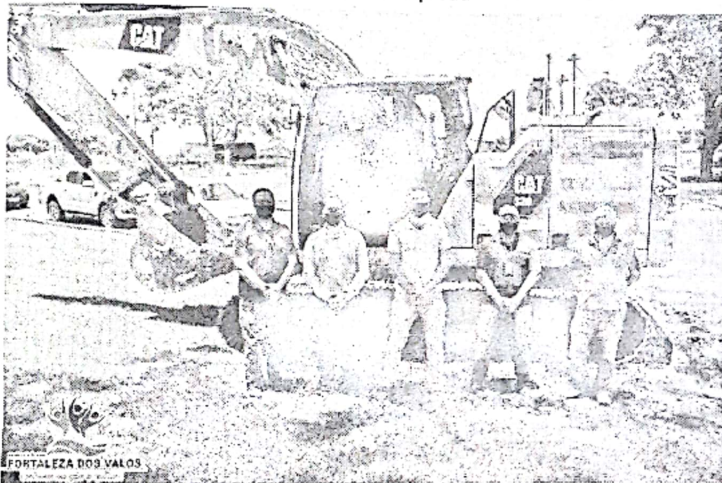
Momento da chegada do maquinário foi acompanhada por representantes do Executivo, Emater, representante do Governo do Estado e edil eleito

A Administração Municipal através da Secretaria de Agropecuária Meio Ambiente e Turismo acompanha as obras com seu departamento Técnico de Meio Ambiente.