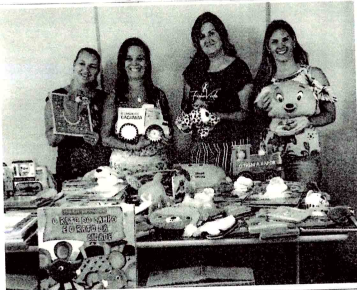
As obras foram adquiridas através do Programa Nacional de Assistência ao Educando (PENAE)

A aquisição dos livros é relacionada a melhoria na metodologia de trabalho dos educadores, que contemplam as exigências e habilidades a serem desenvolvidas, na implementação do novo currículo, dentro da Base Nacional Comum Curricular (BNCC). Os livros foram adquiridos através do Programa Nacional de Assistência ao Educando (PENAE), são mais de 300 livros de literatura infantil, diferenciados na temática e no formato para as EMEIS, pré-escolas e séries iniciais. O investimento no valor de R$7.986,00, visa melhorar e tornar mais lúdico e atrativa a prática da leitura desde cedo. A Administração Municipal investindo para formar nossos pequenos alunos em cidadãos com mais acesso à todas as formas de leitura e expressão.