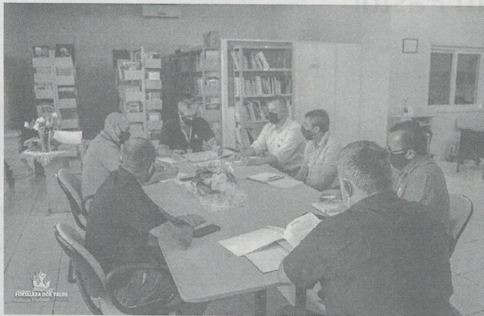
A estiagem foi o assunto central bem como, ações por parte dos Governos Estadual e Federal visando auxiliar o setor agrícola

Foi discutido também sobre as novas porcen-