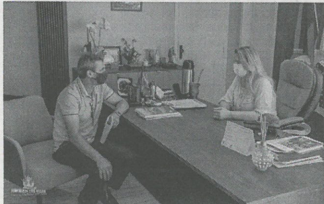
Estiagem esteve entre os assuntos abordados

A Administração Municipal também confirmou o apoio para a participação do município no 10º Grito de Alerta, que ocorrerá em Ijuí no mês de fevereiro.