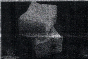
Barras começarão a ser entregues na segunda-feira (30/03)

Outra ação muito importante que está sendo desenvolvida pela secretaria é a confecção de mantilhas para as gestantes dos município, assistidas pela As-