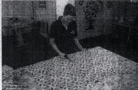
Mantilhas estão sendo feitas pela equipe do CRAS, para serem posteriormente entregues as gestantes que integram os programas sociais do município

Assessoria de Imprensa Poder Executivo - Daniel Lima