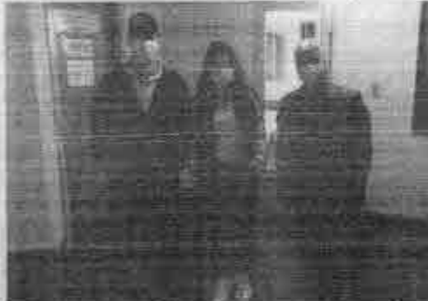
Durante a "blitz" é entregue um panfleto sobre cuidados de higiene que devem ser redobrados como lavar as mãos com água e sabão e passar álcool gel 70%