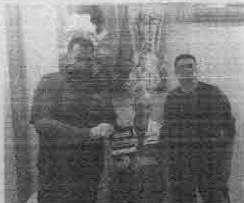
Profissionais de diversos setores estão envolvidos na ação