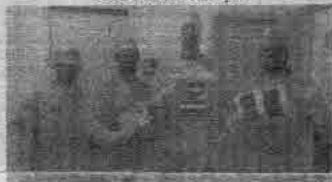
Já foram visitados mais de 600 pontos, entre residências e empresas

A Administração Municipal, através de suas Secretarias, organizou equipes para realizar uma "Blitz da Saúde" na cidade, visando promover orientações e recomendações ao comércio e à população de Fortaleza dos Valos, referente à prevenção ao Coronavírus e os diversos cuidados que devem ser tomados pelos