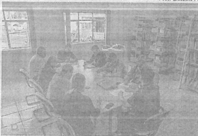
Levantamento apresentado, mostra uma redução de aproximadamente 80% na safra de soja 2021/22 dentro do município

Assessoria de Imprensa Poder Executivo FV