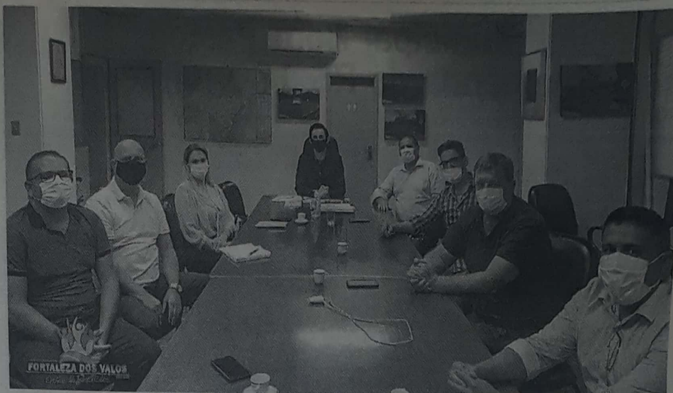
Importante reunião ocorreu no início da semana na capital gaúcha

Na oportunidade, esteve em pauta a atualização dos projetos das rodovias estaduais da região, bem como, a intenção do consórcio em avançar nas formas de conservação das mesmas, entre outros assuntos pertinentes.