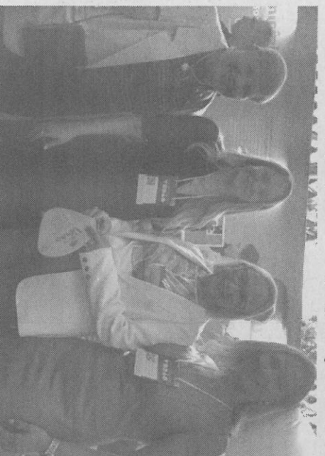
Na imagem, com a Secretária de Saúde do RS - Airla Bergamini

Aconteceu entre os dias 27, 28 e 29 de fevereiro, a Assembleia de Verão da FAMURS, que movimentou o litoral gaúcho. Este é o maior evento municipalista da região, sediado na Sociedade dos Amigos do Balneário Atlântida - SABA, em Xangri-lá/RS. Autoridades de renome marcaram presença no encontro, dentre elas o Governador do Estado do RS - Eduardo Leite, que par-