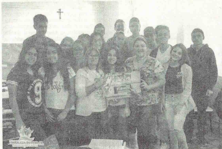
Diretora de Turismo em registro durante visita a turma da Escola Estadual Leopoldo Meinen na qual foi apresentado o projeto