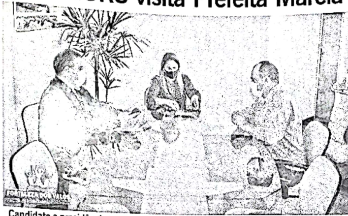
Candidato a presidência da Federação apresentou suas propostas