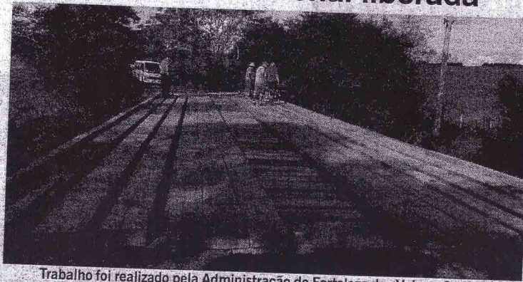
Trabalho foi realizado pela Administração de Fortaleza dos Valos e Cruz Alta

Um trabalho árduo e focado dos servidores do setor de obras, do nosso município e a parceria juntamente com a administração do município vizinho de Cruz Alta.