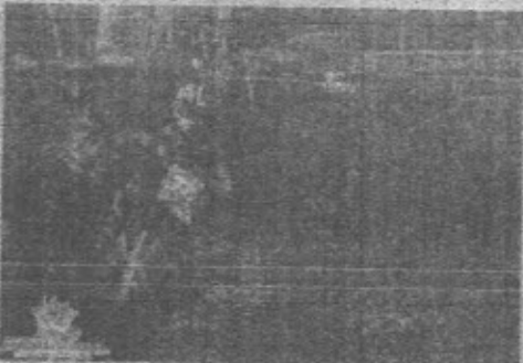
Evento noturno contou com boa participação de pilotos e público regional

A 1ª etapa do Circuito foi uma promoção da Federação Gaúcha de Motociclismo e Grupo Revolution, com apoio da Administração Municipal, que agradecem ao público que marcou presença e da mesma forma, aos pilotos inscritos.