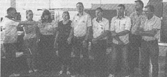
Proprietários da empresa, deixando sua mensagem aos presentes