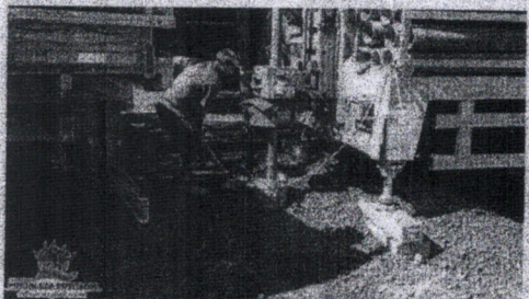
Trabalho realizado nesta semana, beneficiará de 90 a 100 famílias da localidade