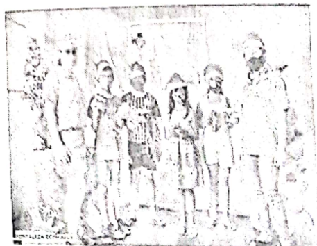
Professoras entregando lembrança a alguns dos alunos