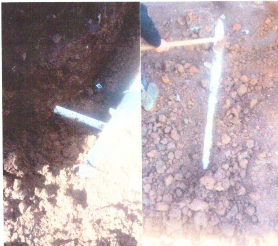
Fotos 06 e 07 - Ligações de esgoto