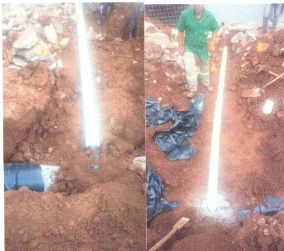
Fotos 08 e 09 - Ligações de esgoto