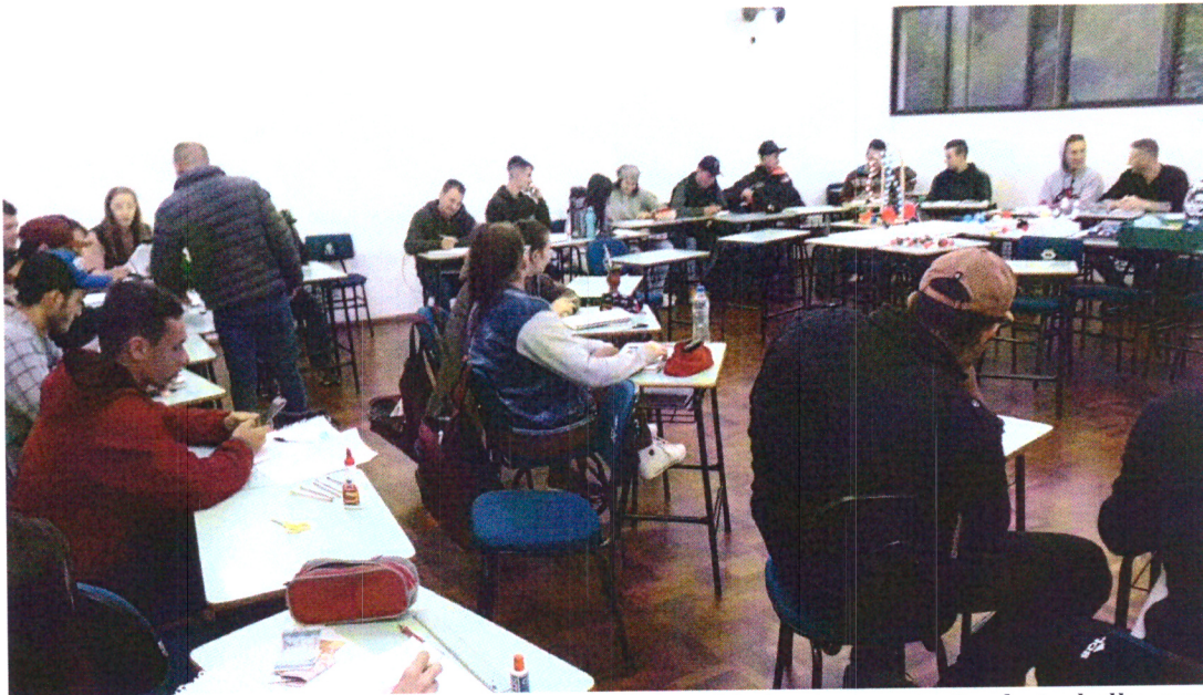
Imagem 03: Atividades/aulas em sala Tempo Universidade: Apresentação de trabalho com elaboração de maquetes.