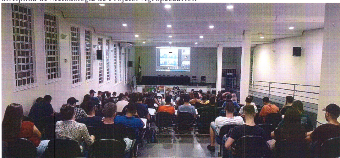
Imagem 06: Aula Inaugural do semestre.