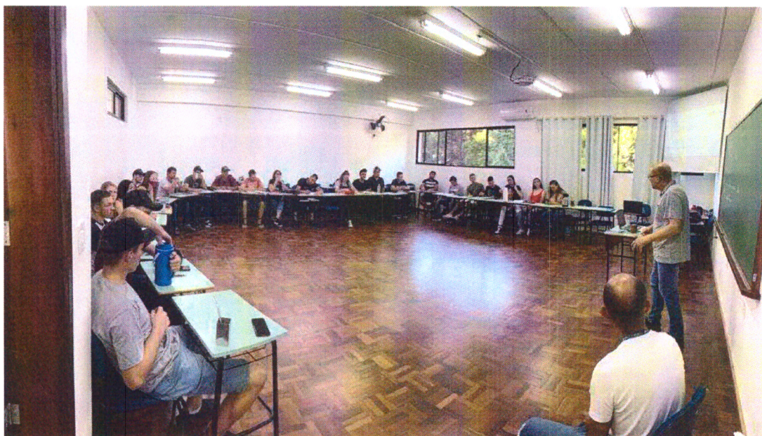
Imagem 01: Atividades/aulas em sala Tempo Universidade.