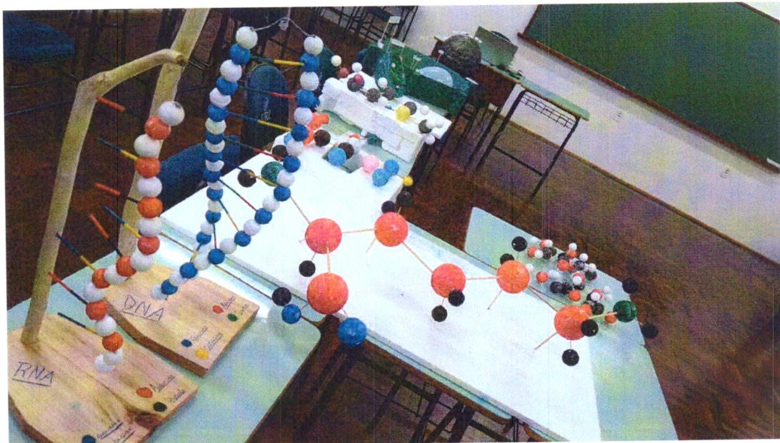
Imagem 04: Atividades/aulas em sala Tempo Universidade: Apresentação de trabalho com elaboração de maquetes.