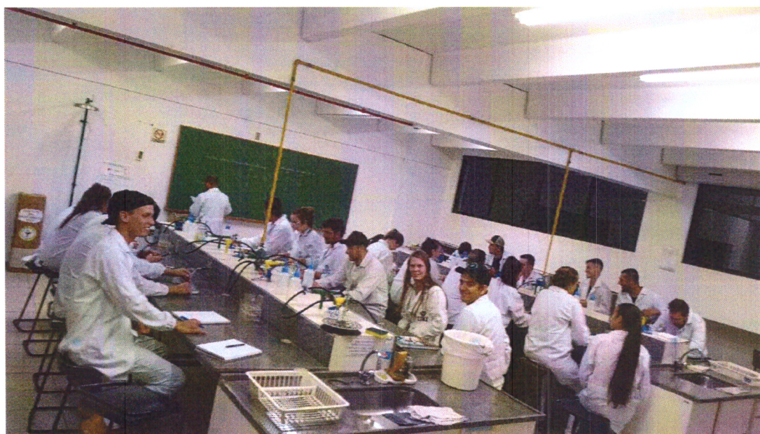
Imagem 02: Aula em laboratório disciplina de Bioquímica Aplicada a Agronomia.