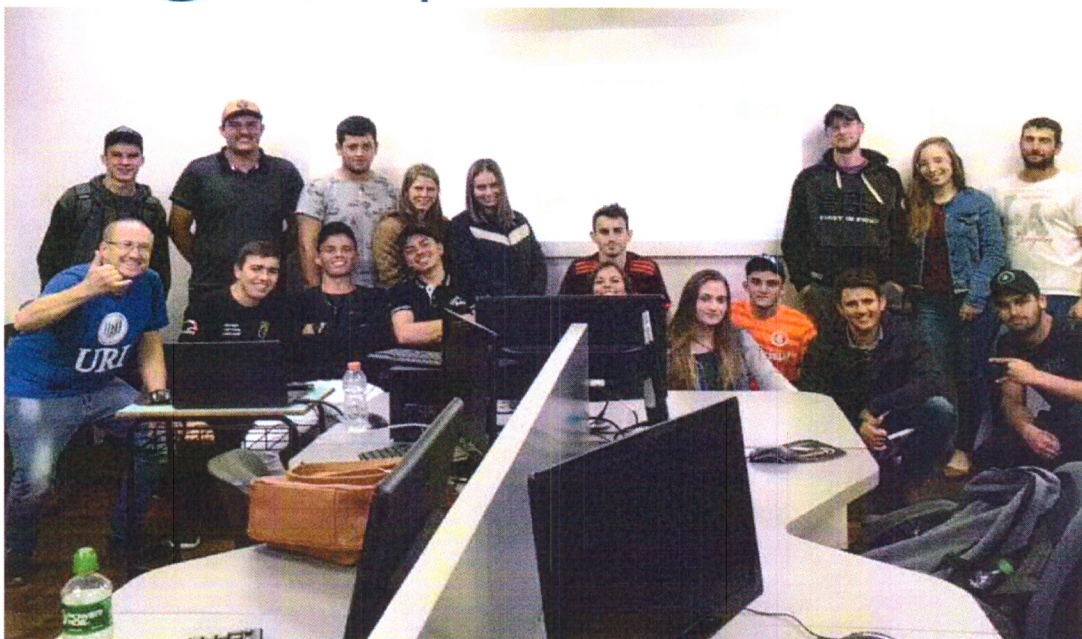
Imagem 05: Atividades/aulas em sala Tempo Universidade: Aula laboratório de informática disciplina de Metodologia de Projetos Agropecuários.