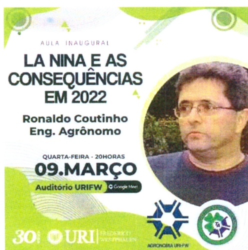
Imagem 07: Aula Inaugural do semestre.