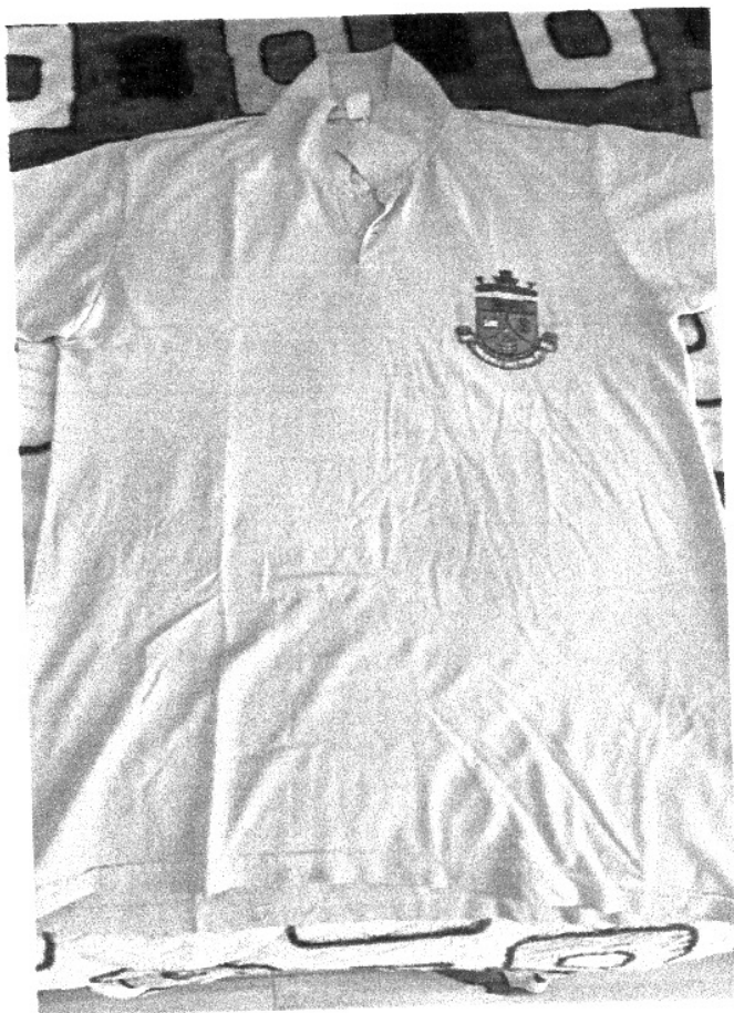
MODELO ILUSTRATIVO DA CAMISA GOLA POLO – ITEM 01